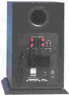
Rückwand AS 100

Der Center 2 sorgt als Speziallautsprecher für ein optimales Zusammenspiel zwischen dem Bild Ihres Fernsehers und dem hochwertigen Surroundklang. Durch seine angeschrägte Schallwand kann der Center 2 direkt auf die Ohrenhöhe Ihrer Hörposition ausgerichtet werden. Der Klang wirkt hierdurch direkter und somit lebendiger als bei herkömmlichen Systemen. Dieser Center ermöglicht eine präzise Ortbarkeit von Sprache und Effekten aus der Bildmitte.